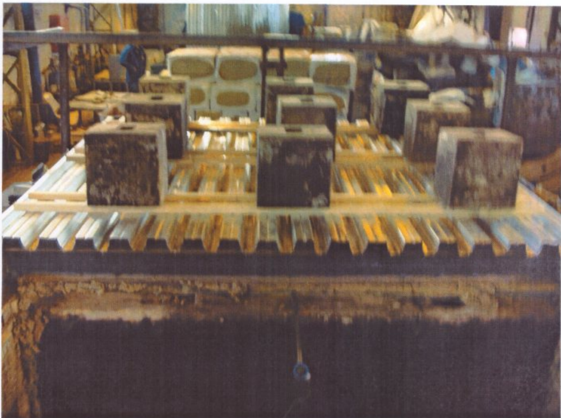
Рис. 2. Опытный образец № 1 с приложенной равномерно-распределенной нагрузкой